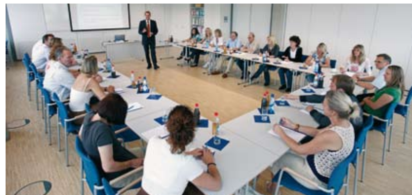
Учебный центр в Одельцхаузене