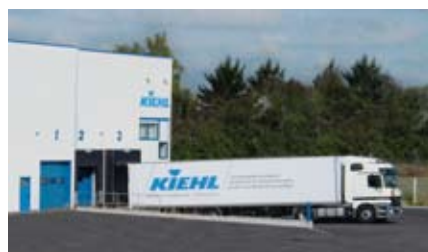
KIEHL FRANCE, BRUMATH CEDEX