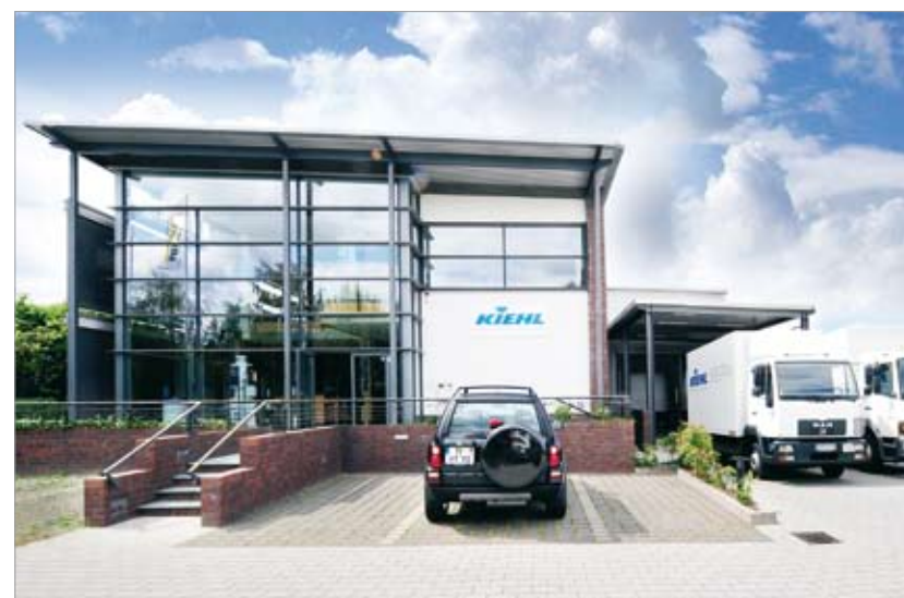
Представительство KIEHL в Гензхаген (под Берлином)

За пределами Германии у фирмы KIEHL также существуют филиалы, представительства, „дочерние“ компании и партнёры по сбыту. Благодаря этому продукцию и консультации можно быстро получить и за границей.