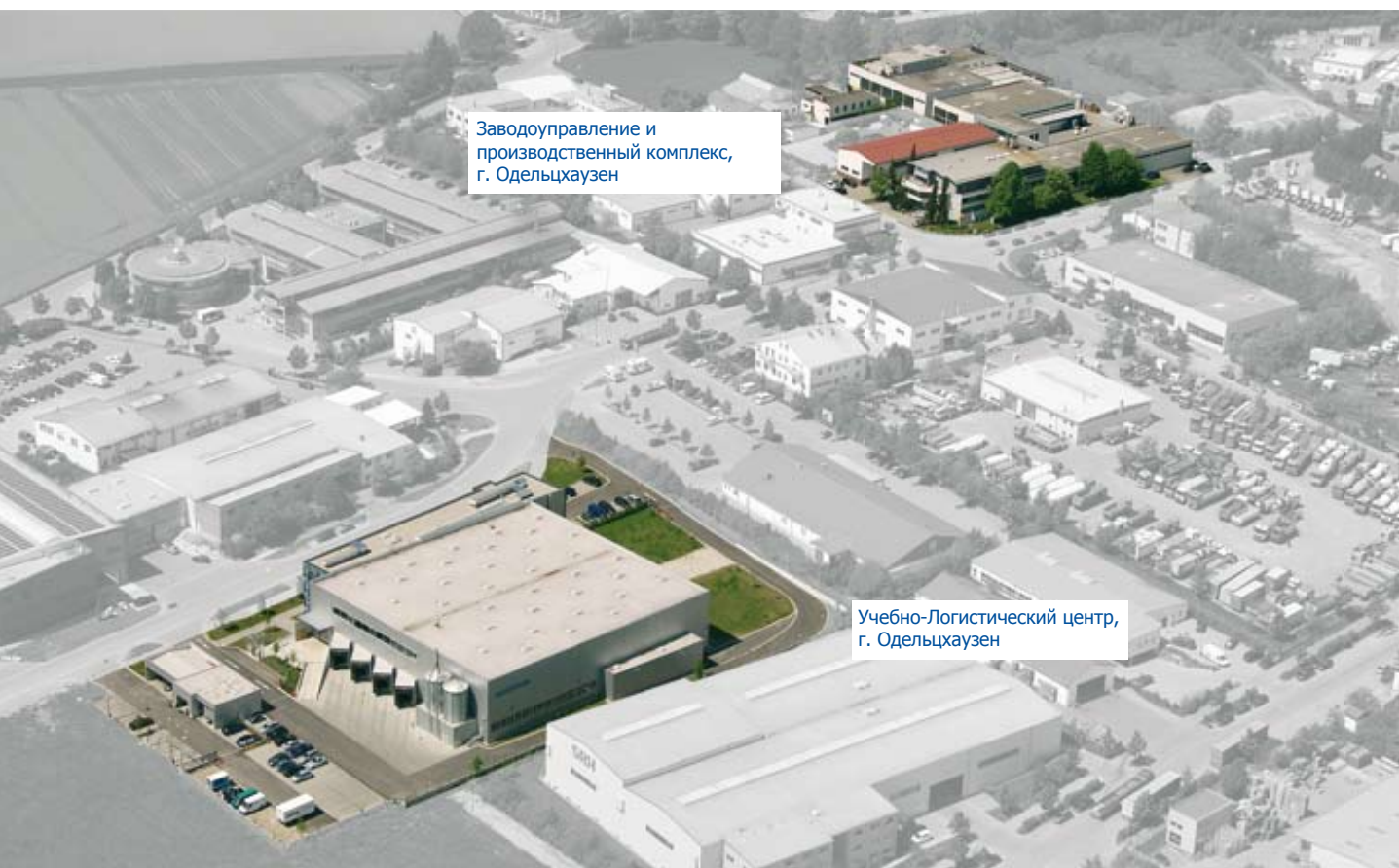
Заводоуправление и производственный комплекс, г. Одельцхаузен

химических средств для профессионального клининга и механизированной мойки автомобилей.