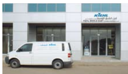
KIEHL Middle East, Abu Dhabi