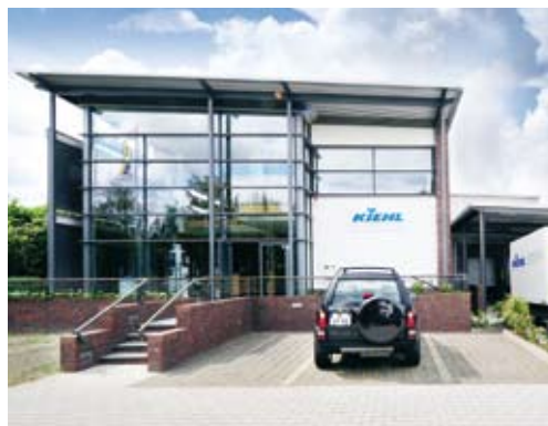
Учебный центр в Гензхагене (под Берлином)